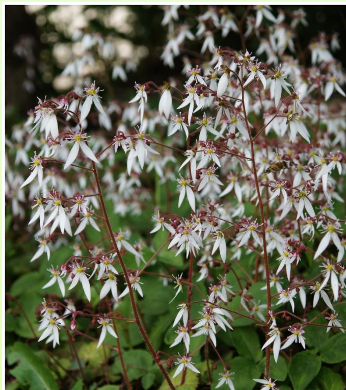
ユキノシタ 利用部位：全草 Saxifraga stolonifera 民間薬としての利用があり、解熱、消炎、鎮咳作用などがある。また、葉は天ぷらや浸し物等、食用にもなる。