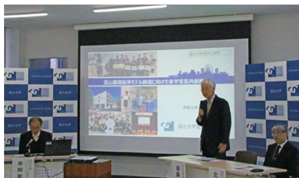
2024年2月26日記者会見の様子

本格型10年間の構想では、不純物を含むアルミスクラップから再生地金の幅広い利用を可能にし、製錬時のCO 2 排出量が大きい新地金の利用を減らすことでカーボンニュートラルに貢献できます。富山におけるリサイクルシステムと循環経済型社会を地域の産学官民の全ステークホルダーと共に構築し、アルミの環境付加価値を向上させ、地域企業の電気自動車(EV)等の新市場への進出を支援します。