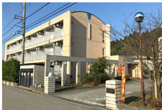
五福国際交流会館