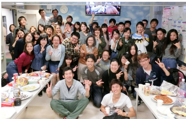
日本人学生主催 「ウェルカムパーティ」