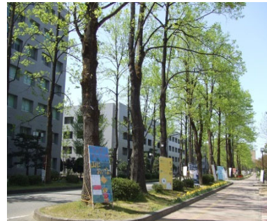
富山大学 (五福キャンパス)

富山大学のある富山市は県庁所在地であり、人口約41万人をかかえる近代的な都市である。北陸新幹線により、東京へは約2時間で移動が可能である。また、市内には富山空港（東京まで約1時間）がある。水と空気と海産物がおおいしく、文化的施設の整っている便利なおとなしき街として、全国的に住みやすい街の最上位にあげられている。