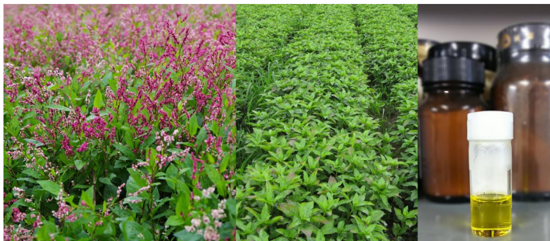
（左・中央）あおり藍の葉、（右）抽出された「あおり藍葉エキス」

本件についての報道解禁は、令和4年（2022年）2月10日（木）23：00（日本時間）とさせていただきます。各社ご協力のほど、よろしくお願いいたします。