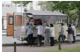
[五福] キッチンカー