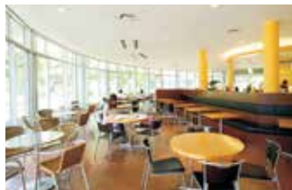
[五福] Open Café AZAMI