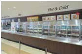
[杉谷] 杉谷食堂 (福利棟)