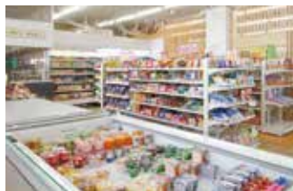
[杉谷] 購買 SUISEN (杉谷食堂2階)