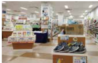
[五福] 購買 (大学食堂2階)

講義に必要な書籍や教材、白衣、パソコン、文具等から、雑貨や日用品まで、多様な品ぞろえ。