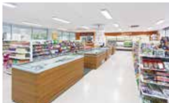
[五福] Tulip (学生会館)