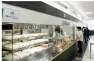
[五福] 第2食堂 (工学部)