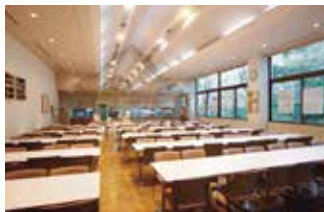
[高岡] 食堂 KATAKAGO