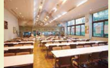
10 食堂 天井の形が特徴的な食堂です。食堂近くには売店もあります。また、キャンパス内にはいろいろな場所に椅子と机があるので、お気に入りの場所で食事をすることができます。