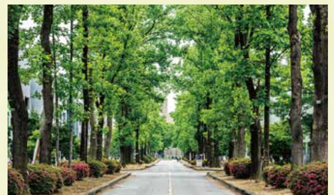
ユリノキ並木道(メインストリート)