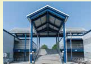
27 学生支援施設(サークル棟)