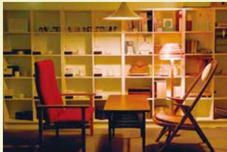
5 コミュニケーションセンター 芸術文化学部ならではのお洒落なアート空間。フィン・ユールやウェグナーなど世界に認められた名作椅子がたくさんあり、自由に触れることができます。学生や教職員の交流の場です。