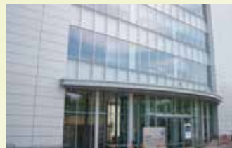
㉑ 医薬イノベーションセンター