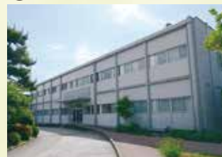
3 保健管理センター