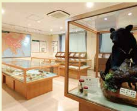
⑬ 和漢医薬学総合研究所