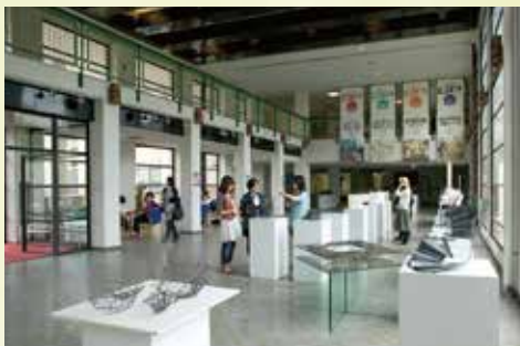
14 TSUMAMA-HALL(エントランスホール) ゆったりとした吹き抜けの空間で窓からは中庭の眺めが広がります。学生たちが制作した作品を展示・発表するスペースとしても活用します。