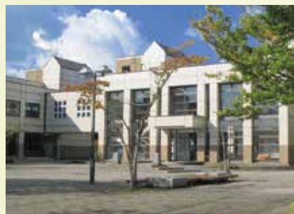
8 芸術文化図書館 芸術関係図書を中心に約7万冊の資料が収集・整理されています。館内の書架や閲覧テーブル、椅子はデザイン性や人間工学の面から配慮され、ゆったりと落ち着いた環境で利用することができます。