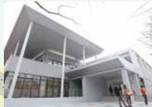
16 31 食堂