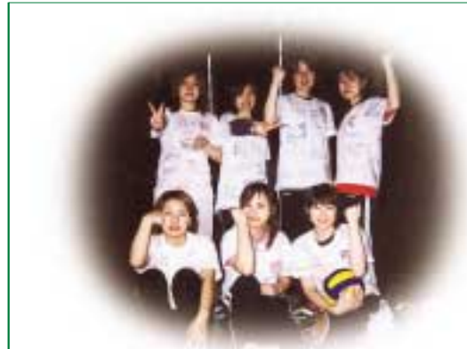
◀英米言語文化講座の女子学生たち