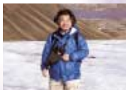
ロングヤービーエン氷河の筆者

す。ライフル訓練はその最初の段階です。この島に棲む数千頭の北極熊からの被害を避けるためなのです。私たちの野外調査でも、随所に北極熊の痕跡が見られましたが、お世話してくださったクリスチャンセン助教はライフルを常時携帯していました。