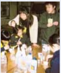
カルメ焼き「うわー、ふくれてきたー」