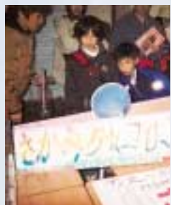
引かにさからうさかみちココロ「どうして坂道を上がるんだろ?」

本年度の目玉企画として「デジタルアスレチック忍者屋敷」を計画しています。この企画は、身体運動とデジタルの世界を融合した楽しい遊びを提供するもので、きっと、新たな人気を呼ぶと期待されています。これ以外にも、定番の人気企画、超巨大迷路、ちびっ子迷路を始めとして、科学で遊ぼう、ものづくりワークショップ