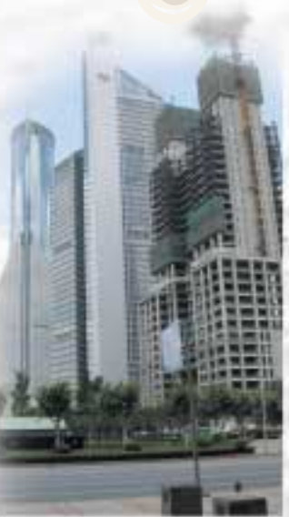
建設ラッシュが進む上海

ばかりではなく、サービス業の対中投資も進み、さらに中国が輸入する際の関税も引き下げられることから、今後は中国が「世界の市場」になっていくことも考えられます。 中国経済の制約要因 一般に発展途上国が成長を続ける過程で、労働者が不足して賃金があがり、労働集約産業から技術・資本集約産業に転換せざるを得ない局面が生じ、その転換がうまくいけばさらなる経済発展が期待できるとされています。しかし、中国では現在、労働集約産業と先端的な技術集約産業が同時に発展しているのです。中国の農村には膨大な余剰労働力があ