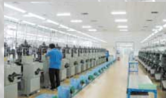
近代的な北京の日系工場

げてきたために、食糧価格が国際市況よりも高くなっています。このためWTO加盟後、国際市場との競争のために食糧価格を上げずに効率を向上させることが求められています。そのため大規模農場化し、機械化を進