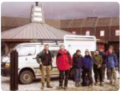
UNISの玄関前にて。永久凍土学会の現地討論参加者らと

ノルウェーのスバルバル諸島は、北緯七十七度八〇度で世界最北の居住地です。人口約一五〇〇人で、日本を含め世界各国がその極地環境を生かす研究施設をここに持っています。