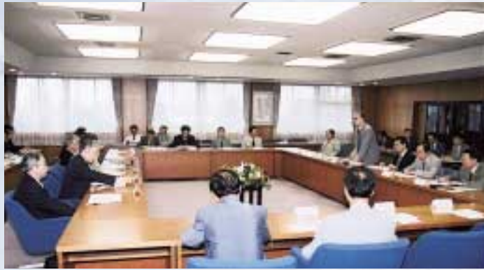
第1回 新大学創設準備協議会

◆富山県内3国立大学による新大学創設準備協議会が発足 本学、富山医科薬科大学及び高岡短期大学の再編・統合による新大学創設準備の協議を行うため、新大学創設準備協議会が設置されました。 7月8日(火)には第1回協議会が本学で開催され、新設する学部や管理運営体制など具体的事項を検討するため、16の部会の設置が承認されました。