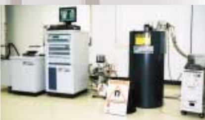
極限環境先進材料評価システム

啓蒙活動としては、世界一といわれるシリコンバレーを作ったスタンフォード大学から講師を招いて講演