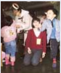
わっか飛行機でビンゴ「えいっ! うまくとべ!」

第5回親子フェスティバルは、地域の皆様と協力しながら、さらに愛される大学づくりをめざして、今年もパワーアップした企画をお届けします。