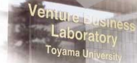
ベンチャー・ビジネス・ラボラトリー正面玄関▲

ベンチャー・ビジネス・ラボラトリー (VBL) は、大学発のベンチャー企業を設立して日本経済に活を入れ、勢いを失い低迷している日本経済を救済するために作られた研究施設です。